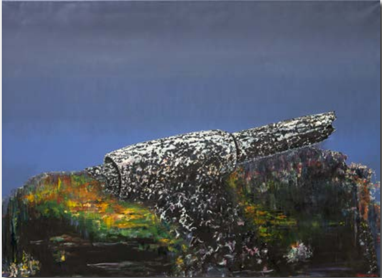
„Werkreihe - tergum - volantem objects - REP 4, Acryl/ Öl auf Leinwand, 110 x 150 cm, 2020