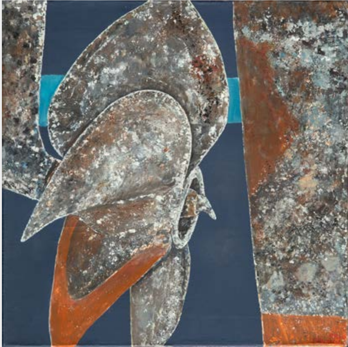
Werkreihe - tergum - aquare ductus 1, Öl auf Leinwand, 50 x 50 cm, 2020