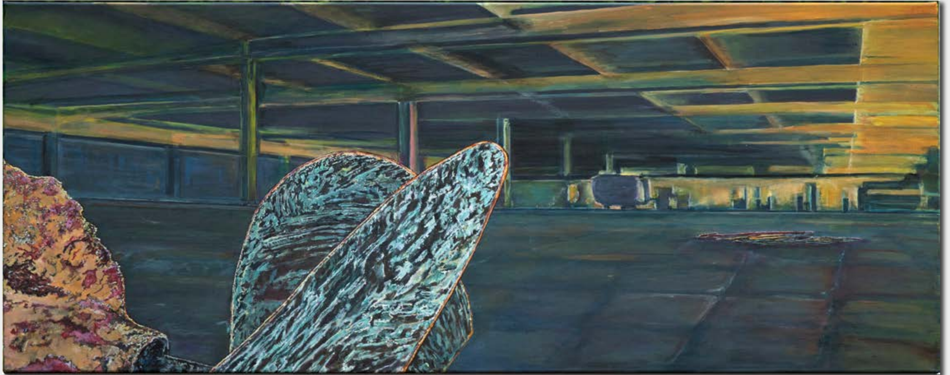
Werkreihe - tergum - opertum loca 2, Acryl/ Öl auf Leinwand, 60 x 150 cm, 2020