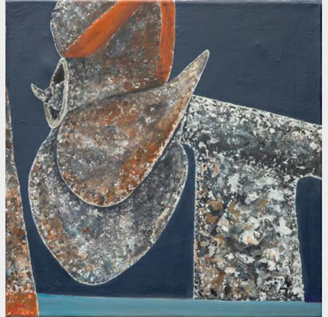
Werkreihe - tergum - aquare ductus 2, Öl auf Leinwand, 50 x 50 cm, 2020