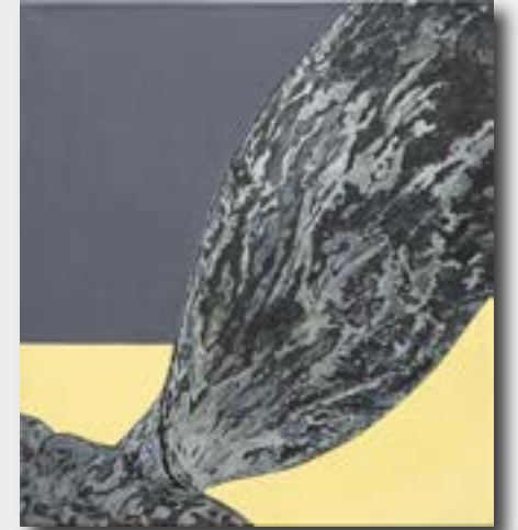
Werkreihe - tergum - Camouflage I - III, Acryl/ Öl auf Leinwand, 100 x 90 cm (100 x 270 cm), 2015/20