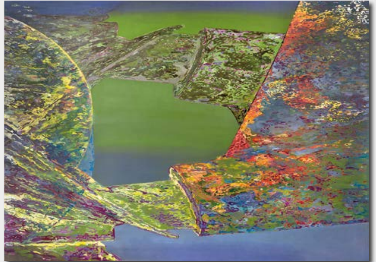
„Werkreihe - tergum - REP 2“ 2015 Acryl / Öl auf Leinwand, 130 x 180 cm