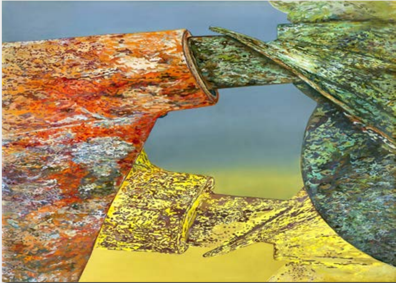
„Werkreihe - tergum - REP 1“ 2015 Acryl / Öl auf Leinwand, 130 x 180 cm